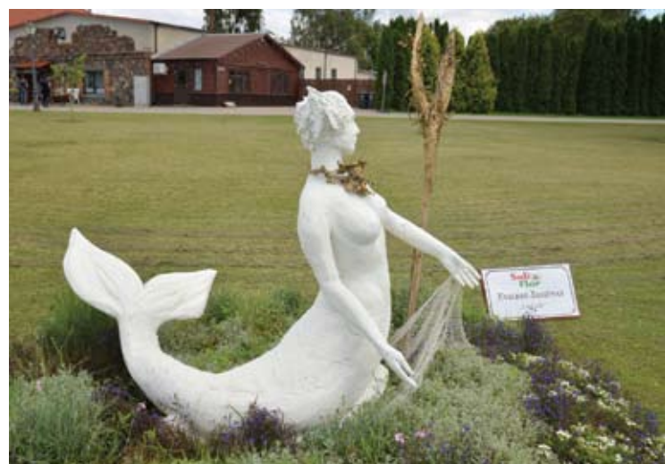
Pakruojo dvare – gėlių ir skulptūrų dermė.